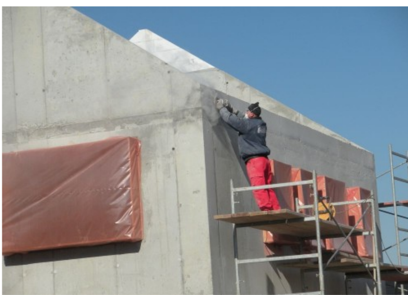
Eerste passieve woning van gestort beton

Pour la première fois en Belgique, une maison construite en béton coulé obtient la certification passive, grâce au savoir-faire de la société Team Construct.